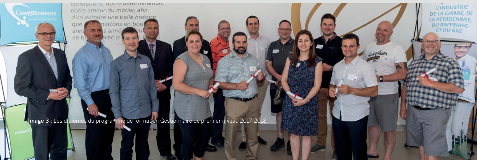
Image 3 : Les diplômés du programme de formation Gestionnaire de premier niveau 2017-2018.

Cette cérémonie a été suivie d'une visite du vignoble, organisée en collaboration avec la CASI (Coopérative d'achats stratégiques industriels).